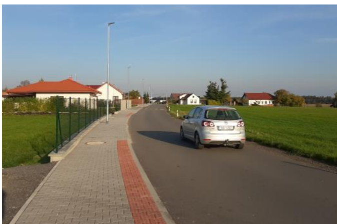
Obec Poběžovice u Holic Realizace chodníku, Poběžovice u Holic

V rámci projektu bylo vybudováno 435 m nového chodníku podél páteřní místní komunikace v Poběžovicích u Holic, jež spojuje 2 komunikace III. třídy (III/3055 a III/3057). V tomto místě chodník dosud nebyl a z důvodu postupného nárůstu intenzity dopravy v obci přibývalo rizikových situací a zvětšovala se pravděpodobnost střetu motorových vozidel s chodci jdoucími po krajnici. To nově vybudovaný chodník vyřešil. Navíc zde vznikla i 2 místa pro přecházení se slepeckou dlažbou a sníženými obrubami. Po ukončení stavebních prací byly okolní plochy znovu osety trávnikem.