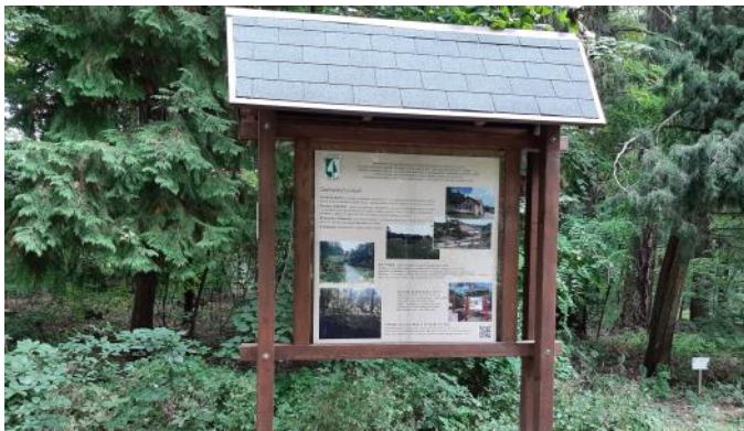
Lesní družstvo Vysoké Chvojno Rekonstrukce stezky pro turisty na PUPFL