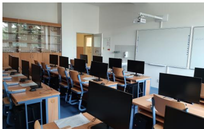
Obec Dolní Roveň Učebna výpočetní techniky ZŠ Dolní Roveň

ZŠ Dolní Roveň využívá 2 budovy v obci. Právě v budově pro 1. stupeň nebyla dosud pro výuku k dispozici počítačová učebna, kde by se žáci mohli seznamovat s moderními technologiemi a novými zdroji informací. A protože pro tuto učebnu chyběly v budově i prostory, tak obec Dolní Roveň ve spolupráci se ZŠ připravila projekt na přístavbu šaten a vybudování nové počítačové učebny a bezbariérového WC v uvolněném prostoru. Učebna bude využívána převážně pro výuku anglického jazyka, ale i v rámci odpoldního kroužku Malý grafik a animátor.